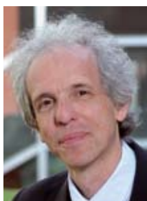
A. Béretz Président de l'Université de Strasbourg