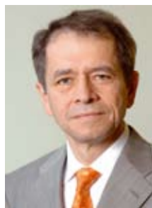
A. Loprieno Recteur de l'Université de Bâle