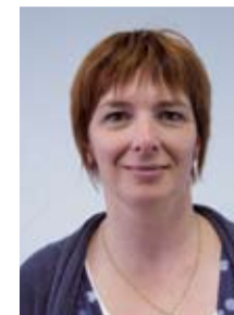
E. Wassereau Service des relations internationales Gestion financière, gestion des bourses, accueil étudiants sortants