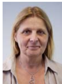
O. Pons Service des relations internationales Accueil des étudiants étrangers, CREPUQ